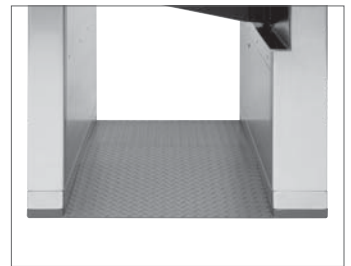
■通路板は段差のない安心設計