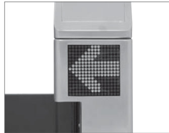
■見やすい通路案内表示