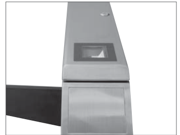
■使用媒体は非接触ICカードもしくは2次元バーコードを選択可能